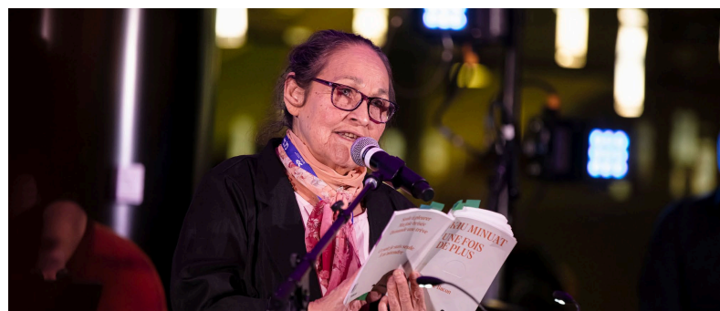
Nuit blanche : La poétesse Joséphine Bacon