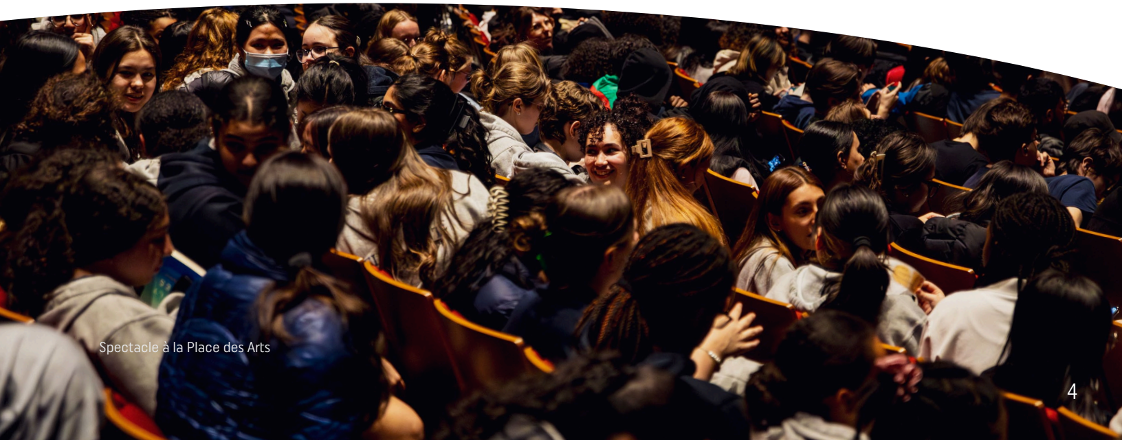
Spectacle à la Place des Arts

Plus de la moitié des élèves ayant participé au programme fréquente une école ayant un indice de défavorisation élevé (de 8 à 10). Ces écoles accueillent un nombre important de jeunes issus de l'immigration qui sont le reflet des 120 communautés culturelles originaires des cinq continents que l'on dénombre à Montréal.