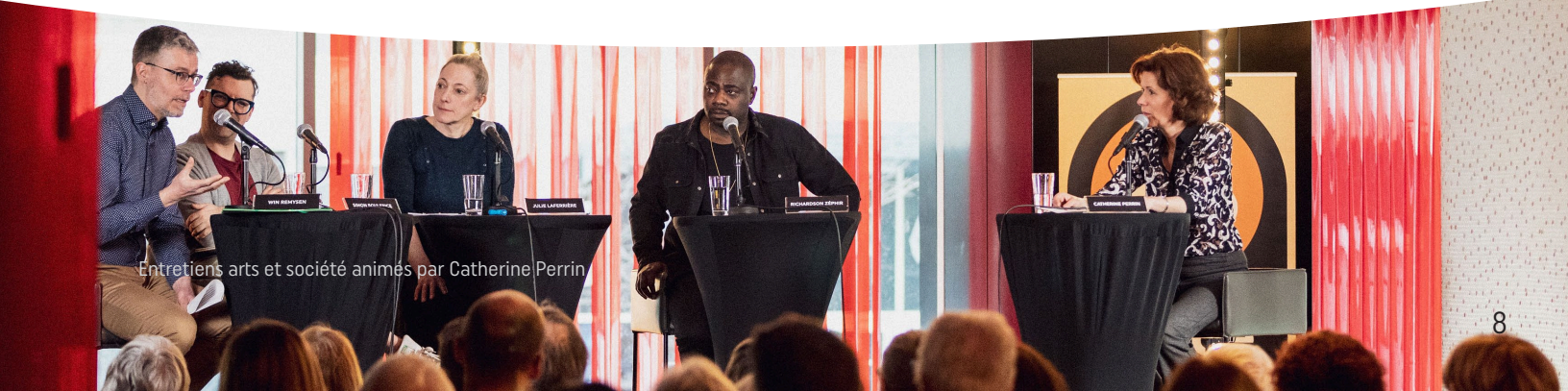
Entretiens arts et société animés par Catherine Perrin