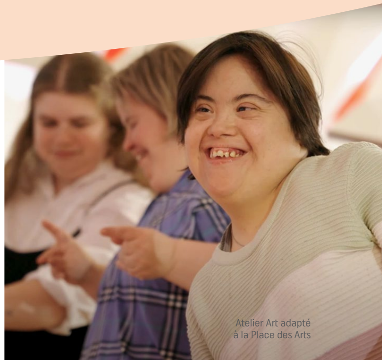
Atelier Art adapté à la Place des Arts