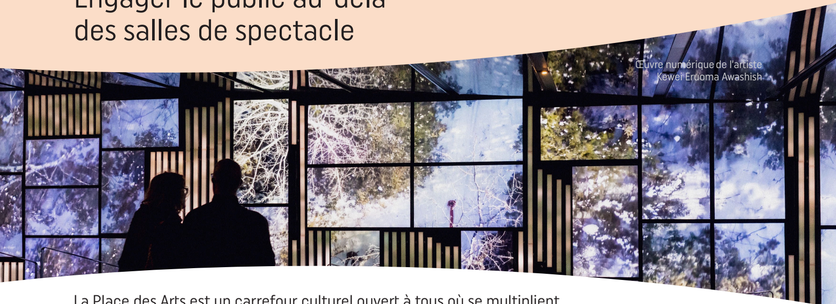
Œuvre numérique de l'artiste Kewei Erdoma Awashish

La Place des Arts est un carrefour culturel ouvert à tous où se multiplient tout au long de l'année des activités diversifiées et des rendez-vous ponctuels.