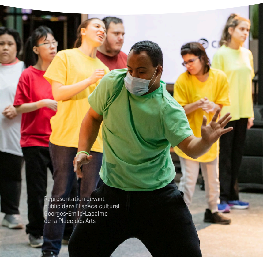
Représentation devant public dans l'Espace culturel Georges-Émile-Lapalme de la Place des Arts