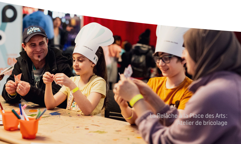
La Relâche à la Place des Arts: Atelier de bricolage

La Relâche à la Place des Arts: Atelier d'arts circassiens