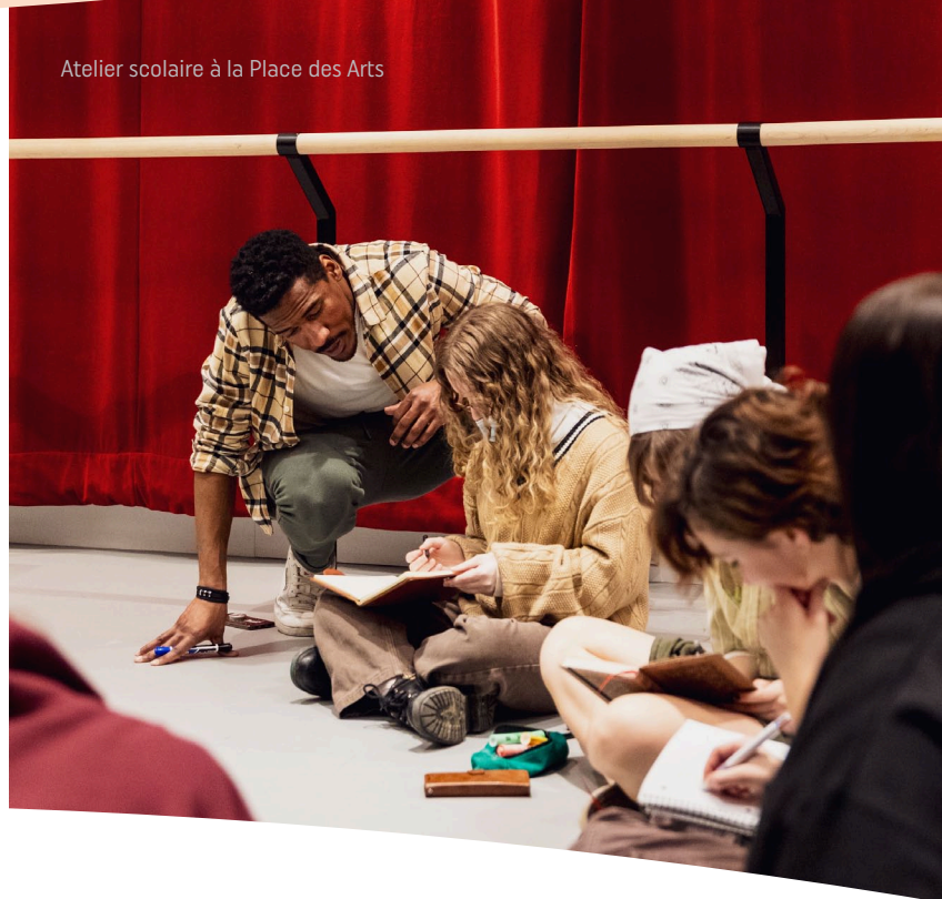
Atelier scolaire à la Place des Arts

Plus de la moitié des élèves ayant participé au programme fréquente une école ayant un indice de défavorisation élevé (de 8 à 10). Ces écoles accueillent un nombre important de jeunes issus de l'immigration qui sont le reflet des 120 communautés culturelles originaires des cinq continents que l'on dénombre à Montréal.